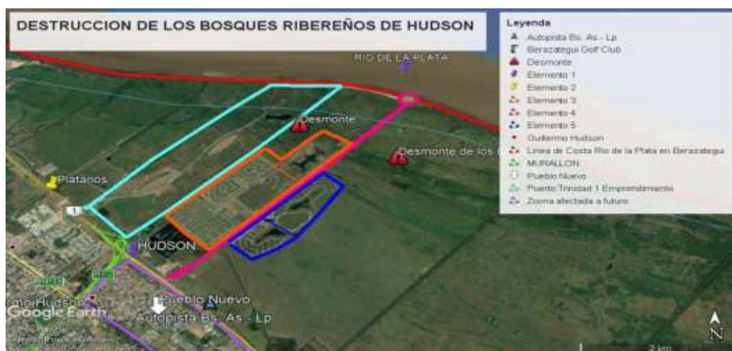
Figura 3. Delimitación de los proyectos inmobiliarios realizado sobre los Bosques Ribereños de Hudson.