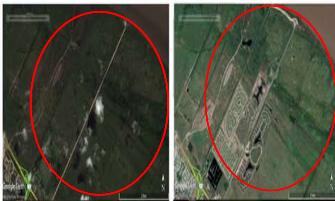
Figuras 4 y 5: Bosques ribereños de Hudson antes de los mega emprendimientos inmobiliarios y diez años después del inicio de los mismos.