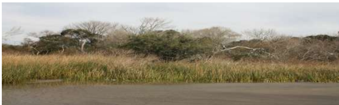
Figura 2. Foto del Bosque Ribereño de Hudson desde el río