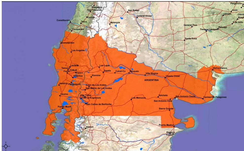
Gráfico 4: Corredor bioceánico de la Patagonia