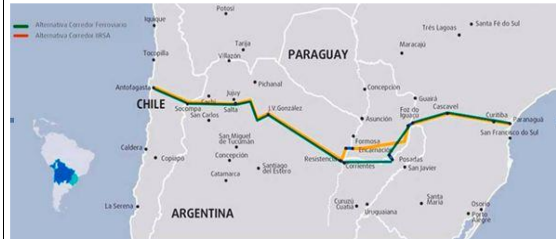
Gráfico 2: Corredor de Capricornio