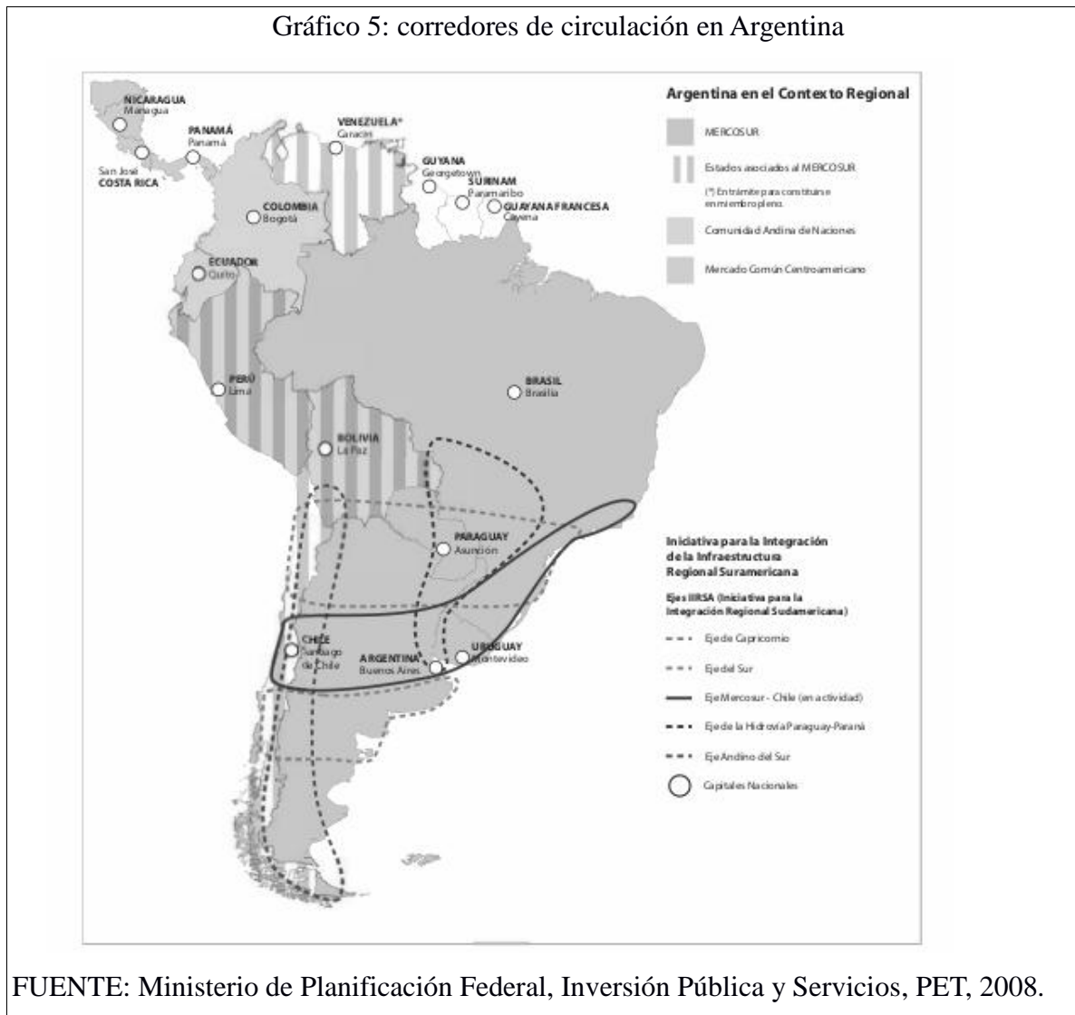
Gráfico 5: corredores de circulación en Argentina