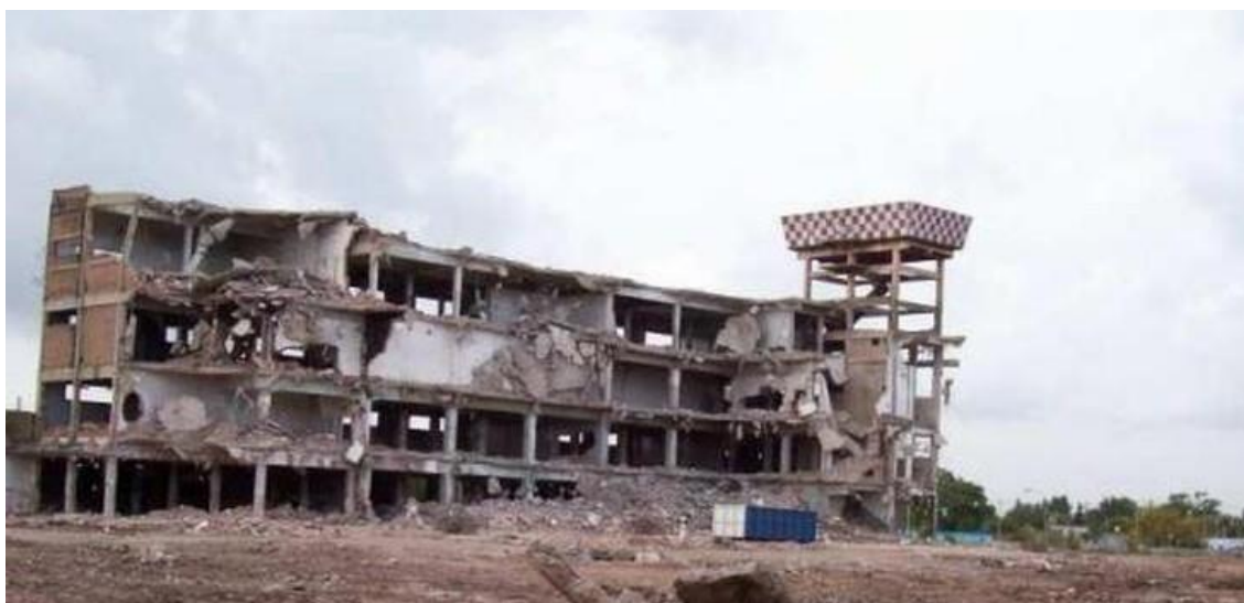
Imagen 1. Parte del predio del Frigorífico Monte Grande