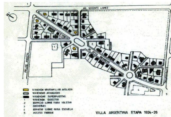
Fig.21 Primera etapa de la urbanización