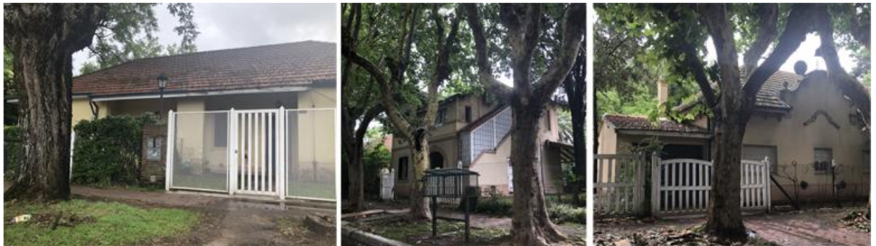
Figura 4. Intervenciones que no respetan la normativa vigente. Se pueden observar: cercos de frente que no respetan las alturas y los colores establecidos, cerramiento de escalera lateral y cambio de carpintería que altera la fachada original.

Figura 3. Portal de acceso a la Villa Argentina y por detrás la vivienda del Director.