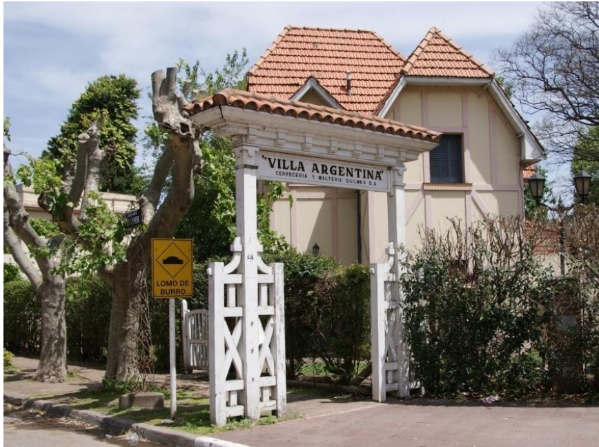
Figura 3. Portal de acceso a la Villa Argentina y por detrás la vivienda del Director.

Figura 2. Una de las plazoletas, la Capilla San José diseñada por el reconocido arquitecto Alejandro Bustillo, y la Escuela N° 30 “General Manuel Belgrano”.