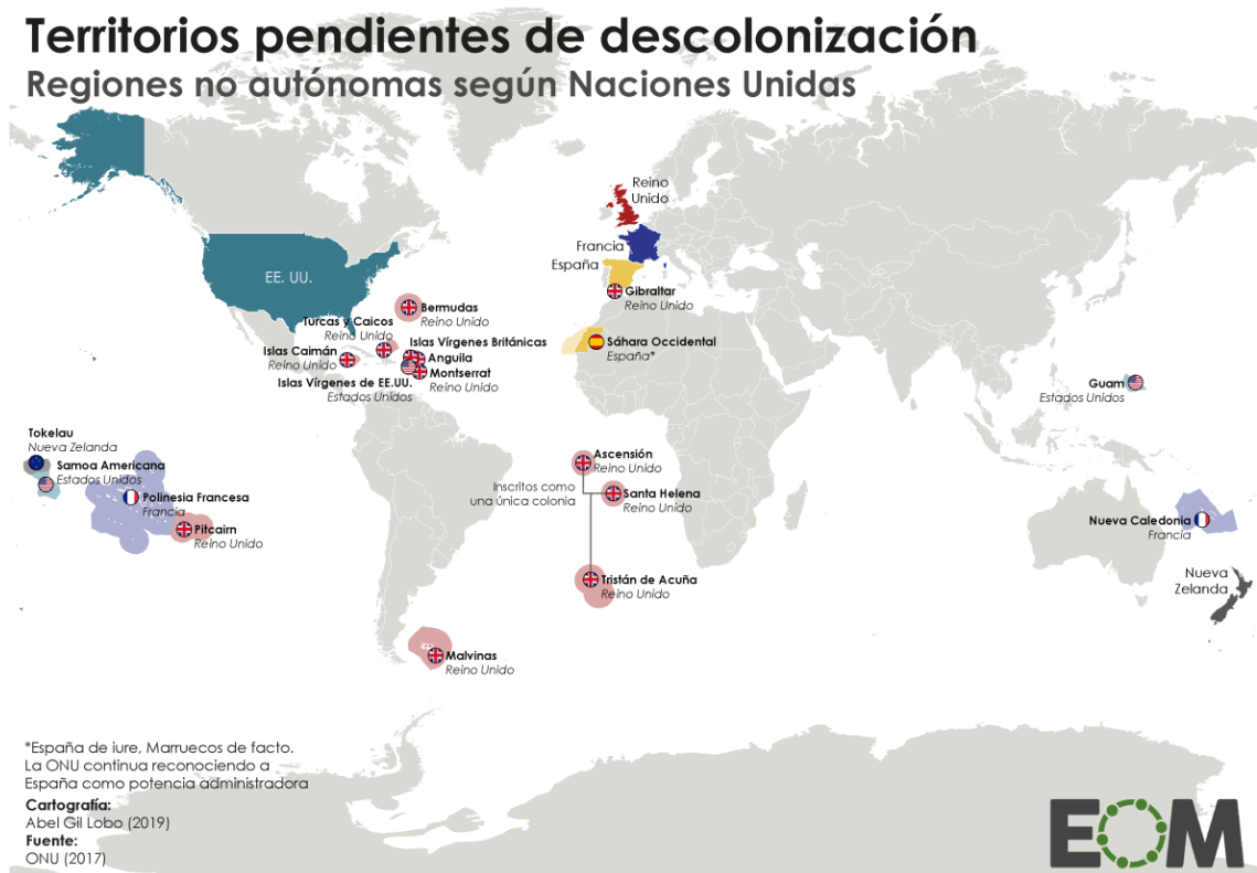
Figura 1. Territorios pendientes de colonización según la ONU.

En la actualidad, existen diecisiete territorios no autónomos o dependientes (ver figura 1), que según la ONU, deben ser objeto de un proceso de descolonización, de los cuales diez pertenecen al Reino Unido.