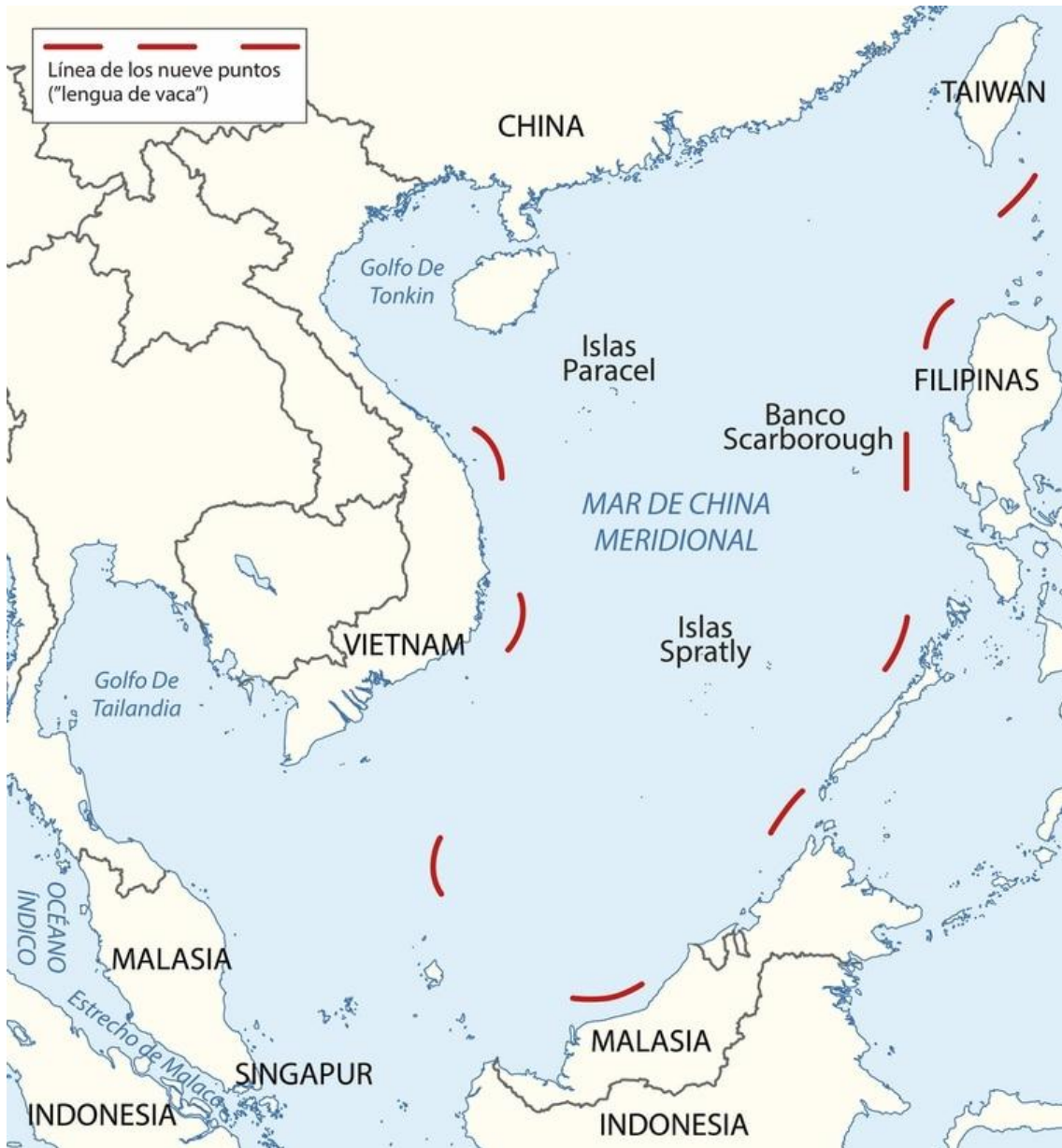
Figura 3. El mar meridional de China.