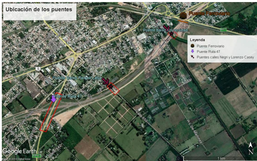
Figura 5. Ubicación de los puentes del tramo de estudio