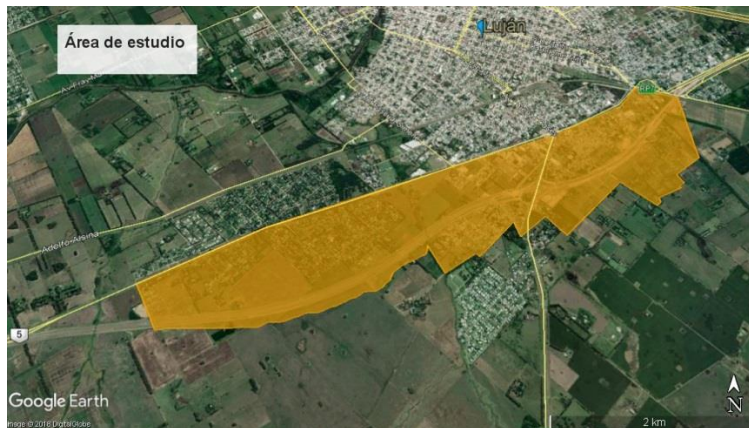
Figura 4: Área de estudio de los barrios de la localidad de Luján