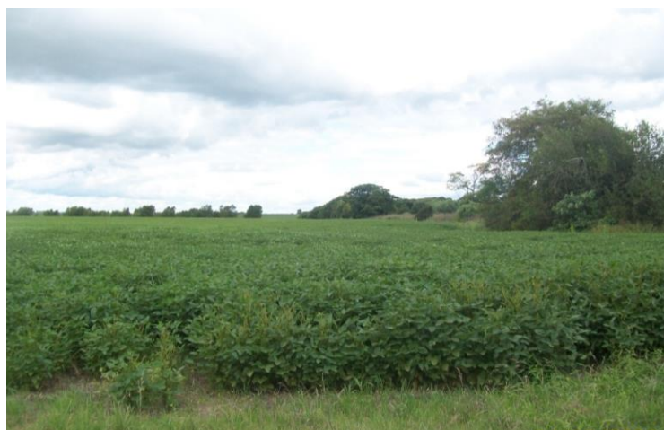
Figura 3. Foto de Santa Coloma, el cultivo de la soja en el límite del pueblo

Además como los pequeños productores no pueden invertir en maquinarias, herbicidas y fertilizantes, se produce la movilidad del sector agrario a actividades en el sector terciario. Los cambios se traducen en la ampliación de las relaciones salariales en el campo, acompañados por la difusión de labores a tiempo parcial entre trabajadores familiares, el predominio de trabajadores transitorios y el aumento de la estacionalidad de las tareas agrícolas. En el caso de las Villas de Portela y Santa Coloma el impacto se vincula con un desplazamiento de la ganadería y las rotaciones de cultivos tradicionales y con la alteración de la calidad de los márgenes de los campos y de las áreas seminaturales del paisaje agrícola. Como se puede observar en la figura 3.