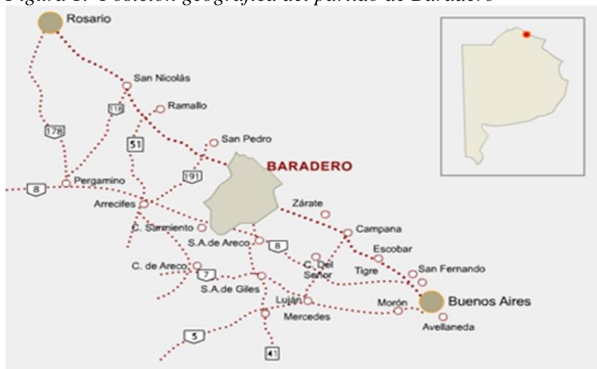
Figura 1. Posición geográfica del partido de Baradero