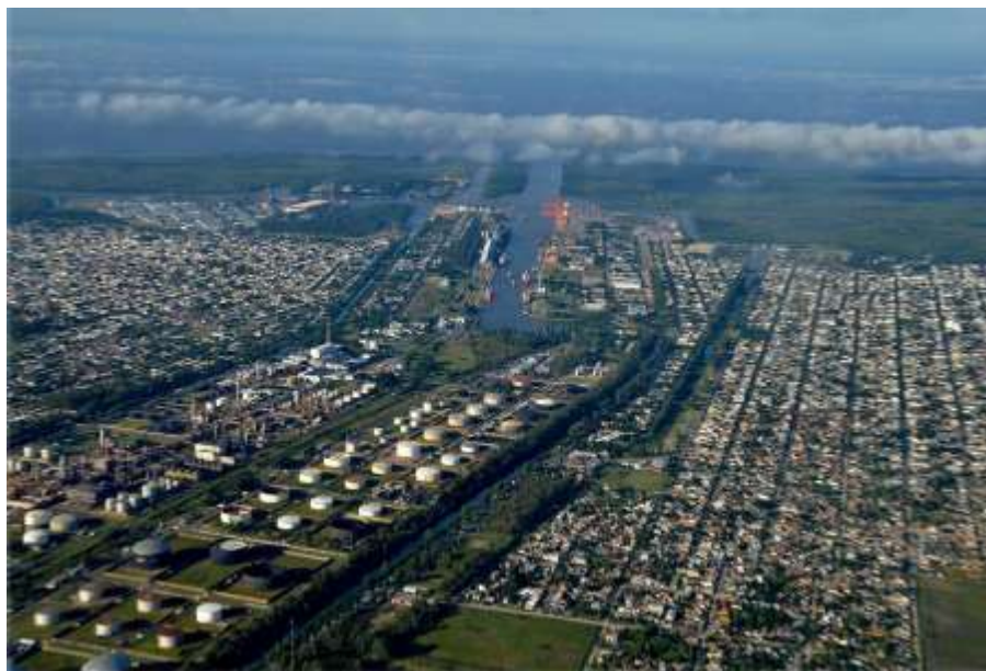
Figura 2. Foto aérea de la Refinería YPF-La Plata en la actualidad

establecimientos de la empresa se implementó una política sociolaboral que ayudaba a la familia del trabajador. La perspectiva de esta política se centraba en mantener al trabajador y a sus hijos como potencial fuerza de trabajo mientras la mujer cumplimentaba el rol de cuidar la familia y la vivienda. Estas condiciones contribuyeron a que YPF se constituyera en un importante promotor de desarrollo urbano y regional (Muñiz Terra, 2012).