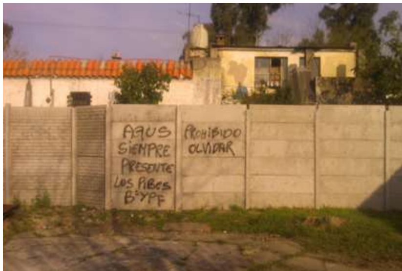
Figura 3. Grafiti en el Barrio YPF de Ensenada