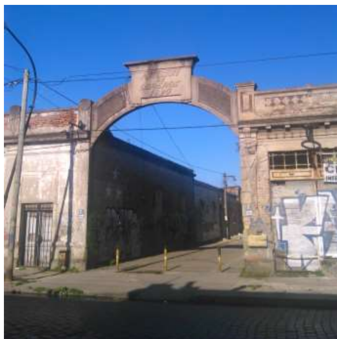
Figura 6. Mansión de Obreros ubicada en la ciudad de Berisso