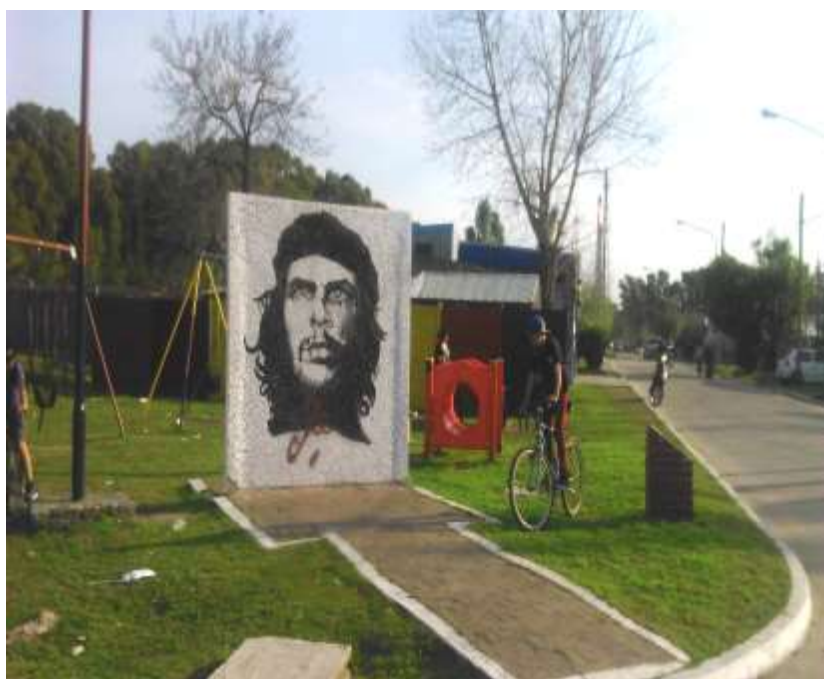
Figura 4. Mural en Barrio Mosconi