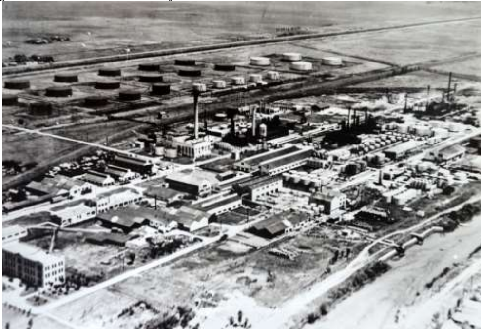
Figura 1. Foto aérea de la Refinería YPF-La Plata, inicio de actividades año 1925