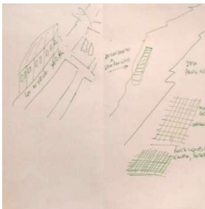
Figura 8. Mapa del embarcadero a la Isla Paulino

Fuente: Dibujo realizado por trabajador de YPF, trabajo de campo Agosto de 2016