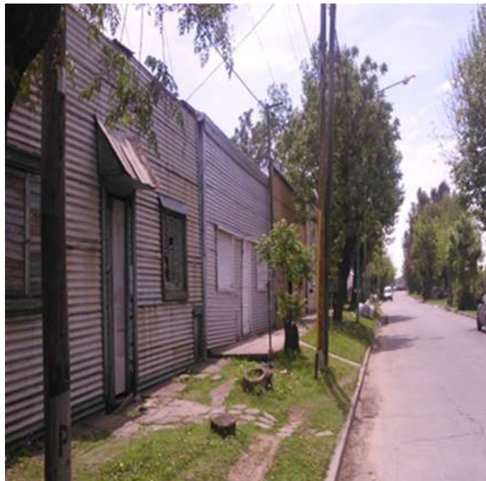
Figura 5. Fachadas de casas de chapa típicas en la ciudad de Ensenada