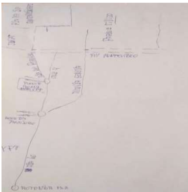
Figura 9. Mapa de recorrido laboral