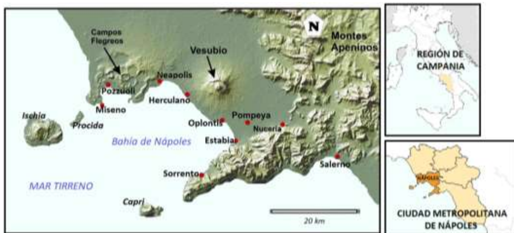
Figura 2: Ubicación del volcán Vesubio y alrededores.