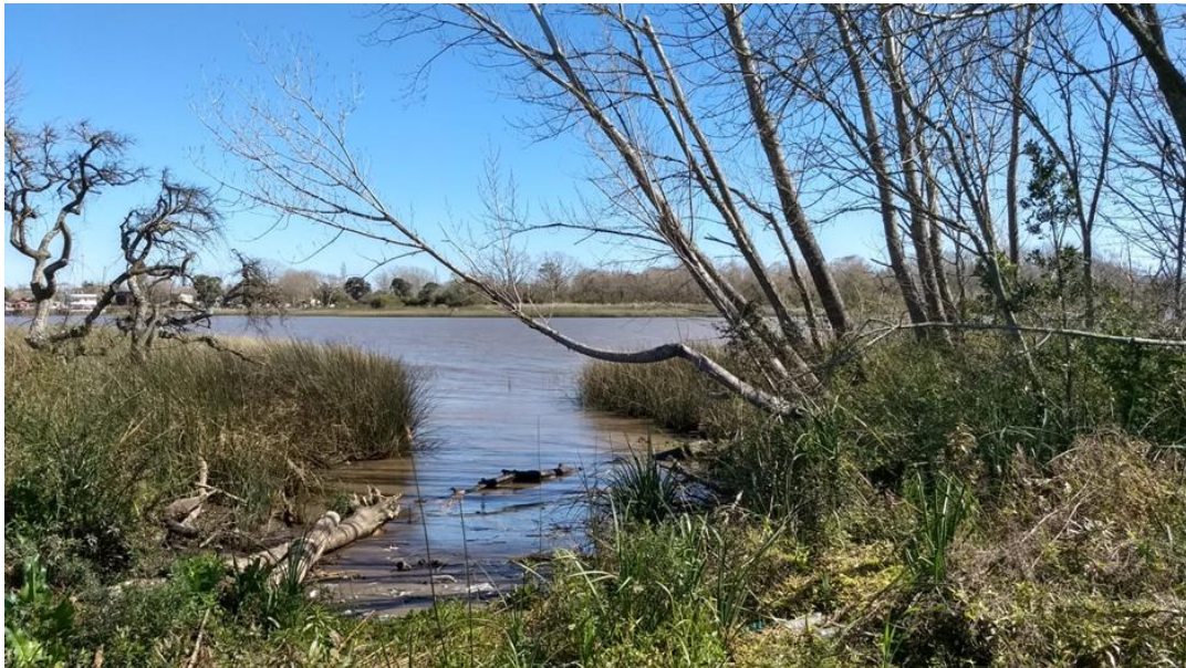
Figura 2: Humedal en la Isla Paulino.