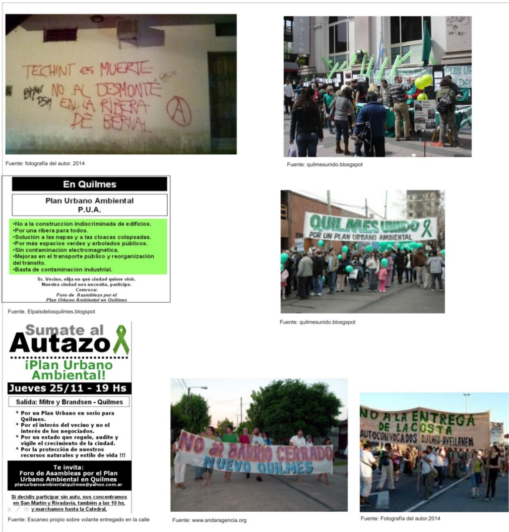
Figura 3. Actores reactivos en Quilmes.