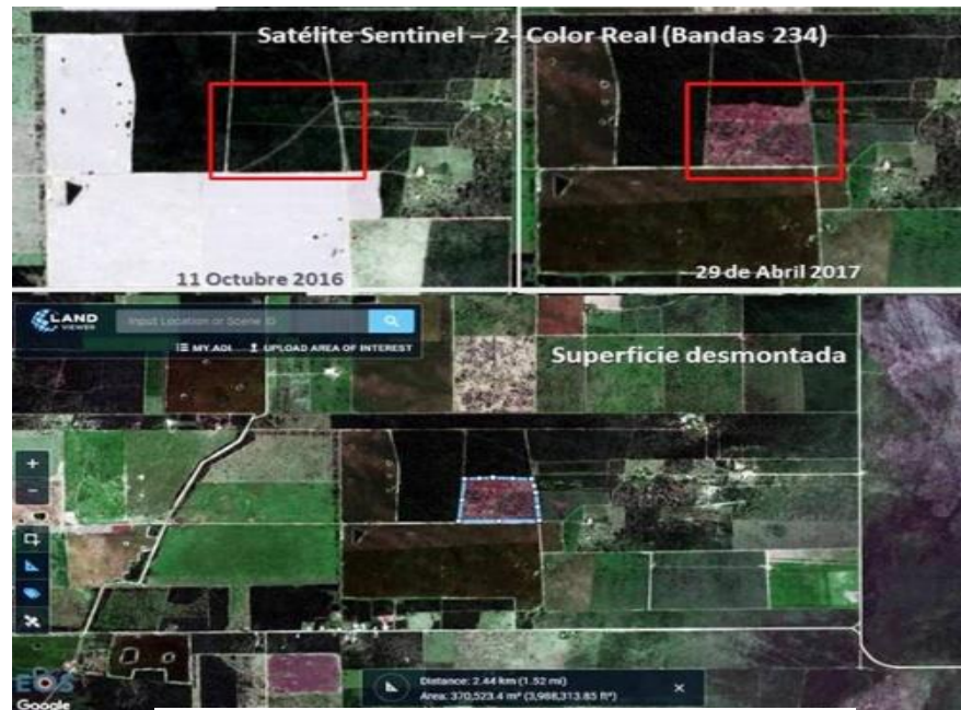
1 Imagen satelital del desmonte. 2017