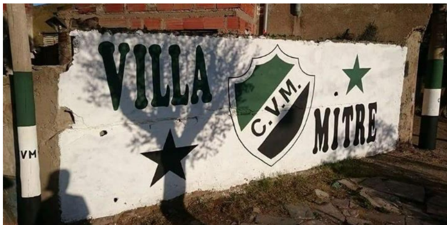
Figura 1. Mural dedicado a “La Gloriosa” (Club Villa Mitre)