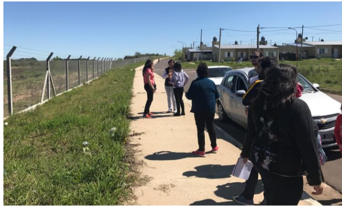
Figura 2. Parada en el Trabajo de Campo.