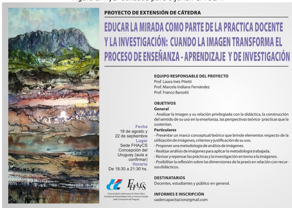
Figura 1. Flyer utilizado para difundir el PECAT

Fuente: Área de Comunicación de la Facultad de Humanidades, Artes y Ciencias Sociales, Sede Concepción del Uruguay.